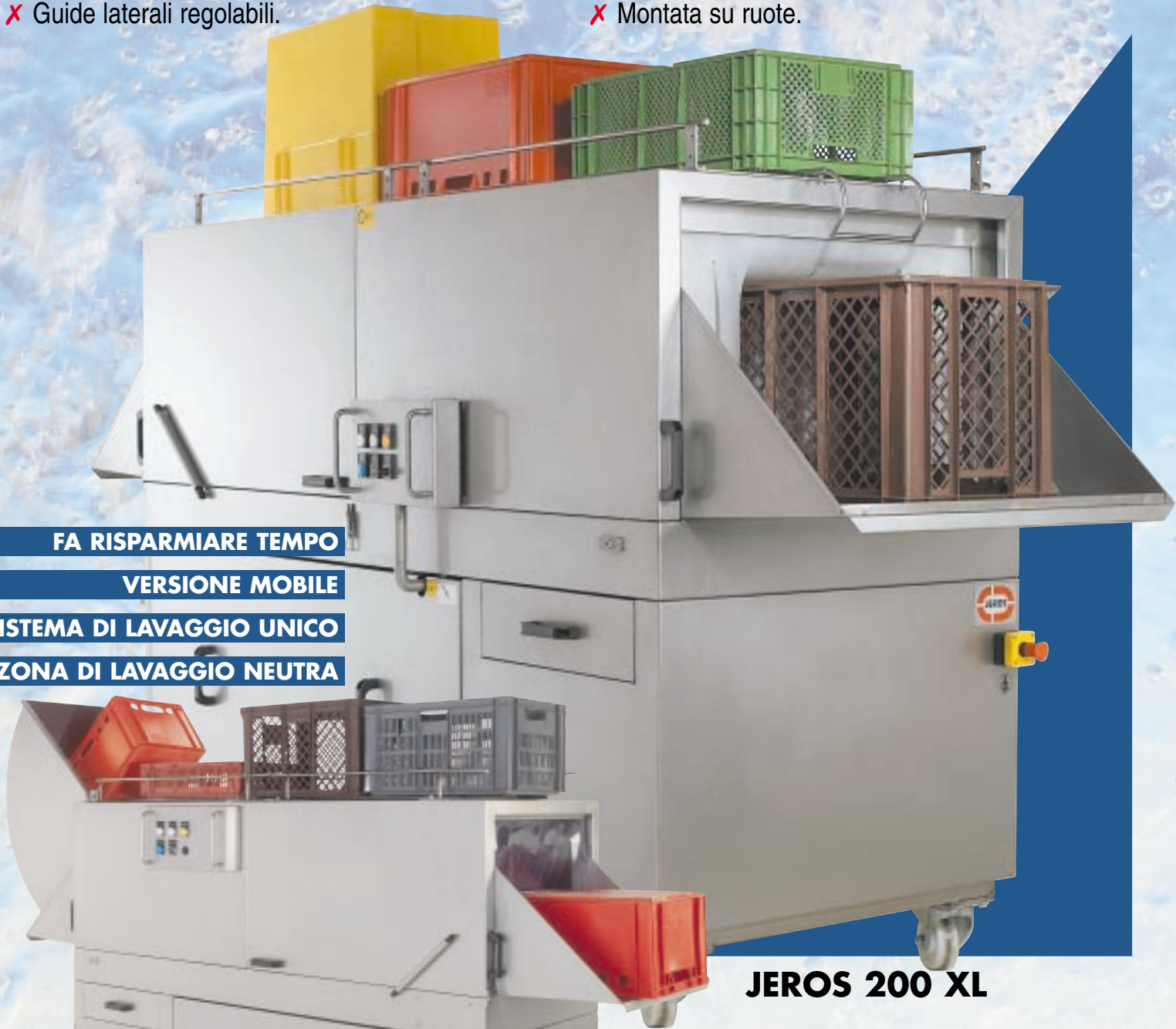
JEROS 200 XL