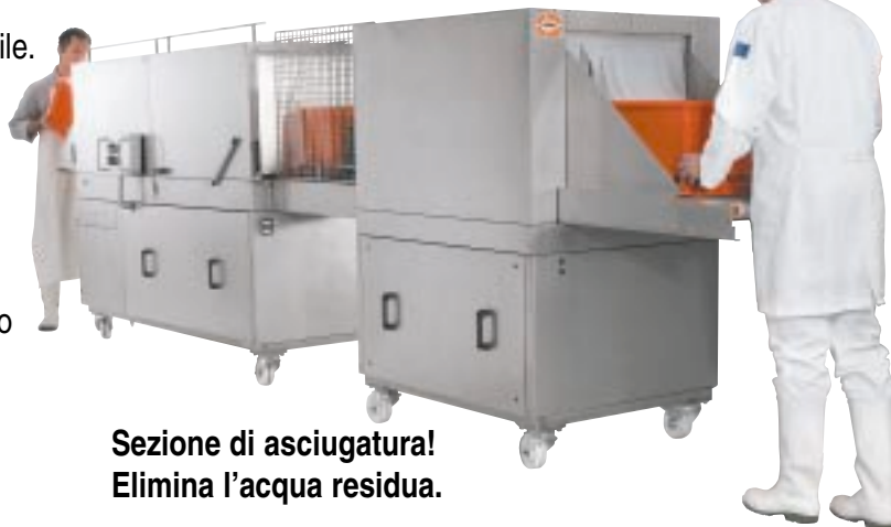
Sezione di asciugatura! Elimina l'acqua residua.

Facile pulizia e manutenzione Il sistema di apertura della parte superiore del tunnel di lavaggio permette di effettuare facilmente le operazioni di pulizia e manutenzione