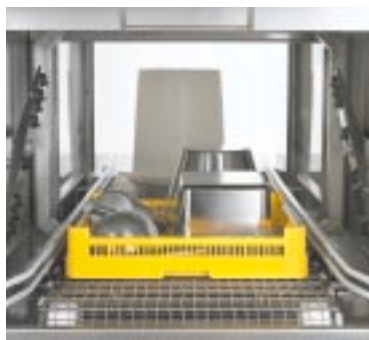
Macchina con nastro trasportatore in maglia d'acciaio inox