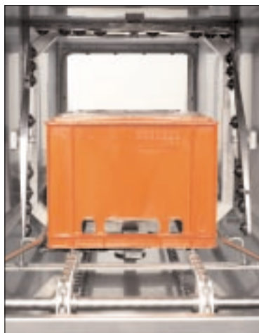
Quattro braccia rotanti!!