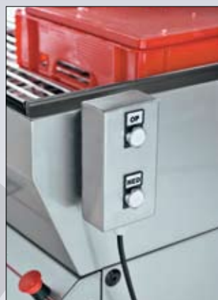
Panel de mandos móvil