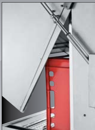
Sistema automático de apertura de la tapa